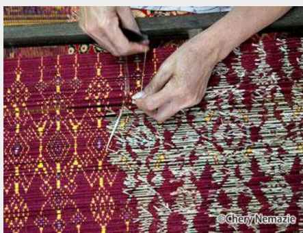
クメールシルクを織る職人の最高峰の技術を見学することができます