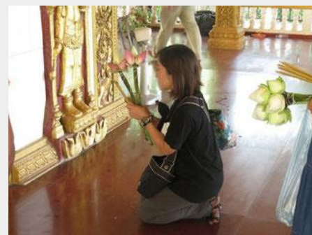
カンボジア式のお参りを学び、地元の方々と一緒にお参りします