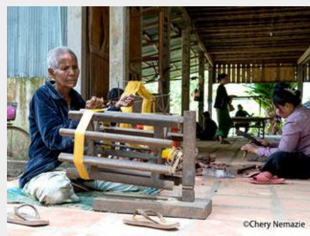
見学者は、工房で働いている職人の傍で製作の見学ができます