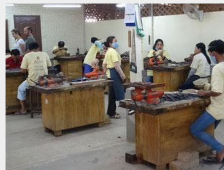
見学者は、工房で働いている職人の傍で製作の見学ができます