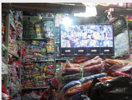
卸しの店が多いので、商品が大量に保管・販売されています