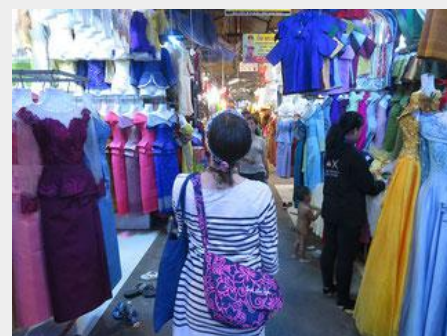
シムリアップ最大の市場プサールーの衣料品コーナー