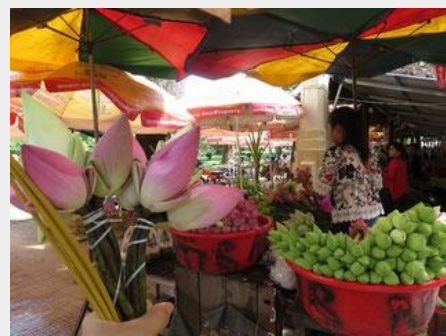
寺院の近くのお店で線香と蓮の花を準備します（日本語ガイドが準備します）