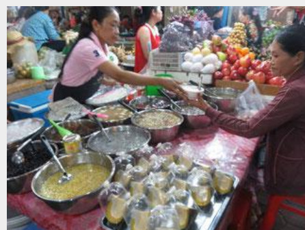
肉や魚、野菜や果物コーナーのすぐ横に甘味屋台もあります