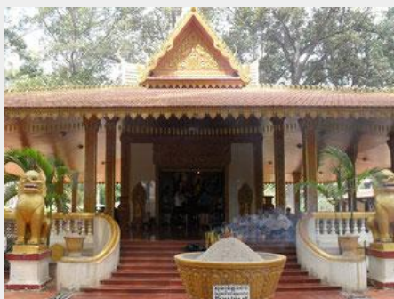
地元の方々が参拝する寺院。特に仏日は非常にたくさんの方がお参りされます