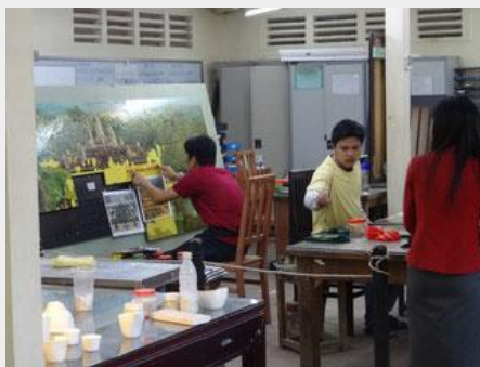
石と木の彫刻、漆器、金箔、陶器、銀メッキ、絹の絵画等の工房見学ができます