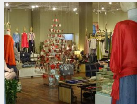
職人が製作した商品を陳列／販売しています