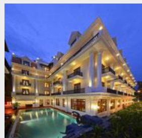
ロイヤルクラウンホテル（朝食ビュッフェ&プール付き）詳細はこちらから >