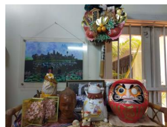
お客様より頂いた縁起物コーナー

4月1日よりオフィスを移転いたしました。ますます精進いたしますので今後とも何卒宜しくお願い申し上げます。