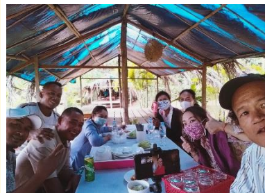
オークンツアーメンバー集合