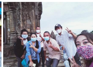
プノンバケンで記念撮影