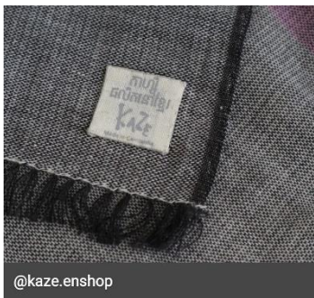
KAZEのロゴマーク付き