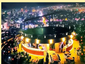
美しい夜景が望めます