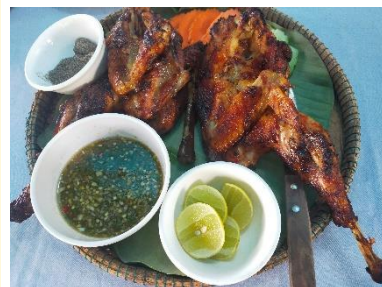
大人気のまるごと鶏肉焼き