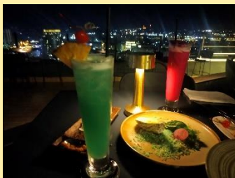
お洒落なカクテル

生憎の曇り空。それでもみんなで出かける遺跡に気分は上々！ワクチン接種を進めたり入国時の隔離期間を短くしたりと、少しずつではありますが復興しつつあるカンボジア。日本の皆様の自由な往来が可能となりますように！あと少し、頑張りましょう。