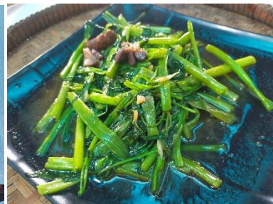
砂肝と空心菜の炒めもの

生憎の曇り空。それでもみんなで出かける遺跡に気分は上々！ワクチン接種を進めたり入国時の隔離期間を短くしたりと、少しずつではありますが復興しつつあるカンボジア。日本の皆様の自由な往来が可能となりますように！あと少し、頑張りましょう。