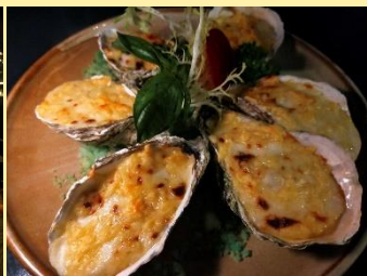
充実の各種おつまみ