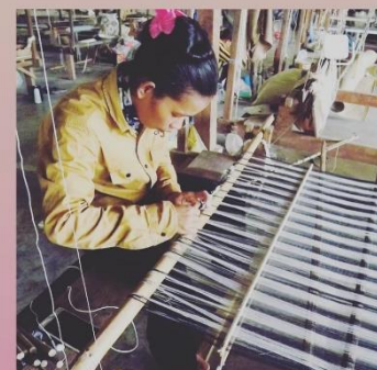
村の女性たちが一枚一枚丁寧に織り上げました！